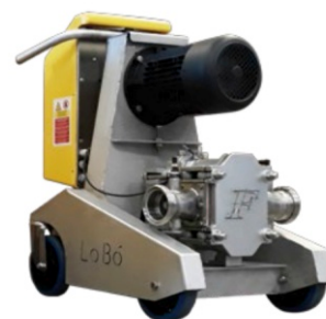
LoBó SÍLA, KTEROU POTŘEBUJETE