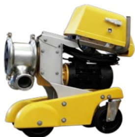
Caterina JEDNODUŠE VÝKONNÁ