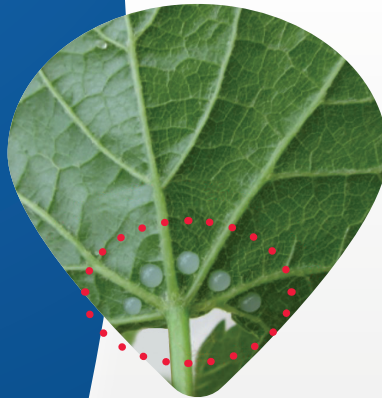
Kapky Videryo F na spodní straně listů